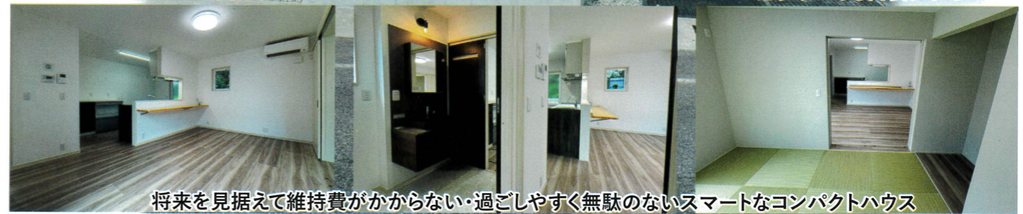
将来を見据えて維持費がかからない・過ごしやすい無駄のないスマートなコンパクトハウス